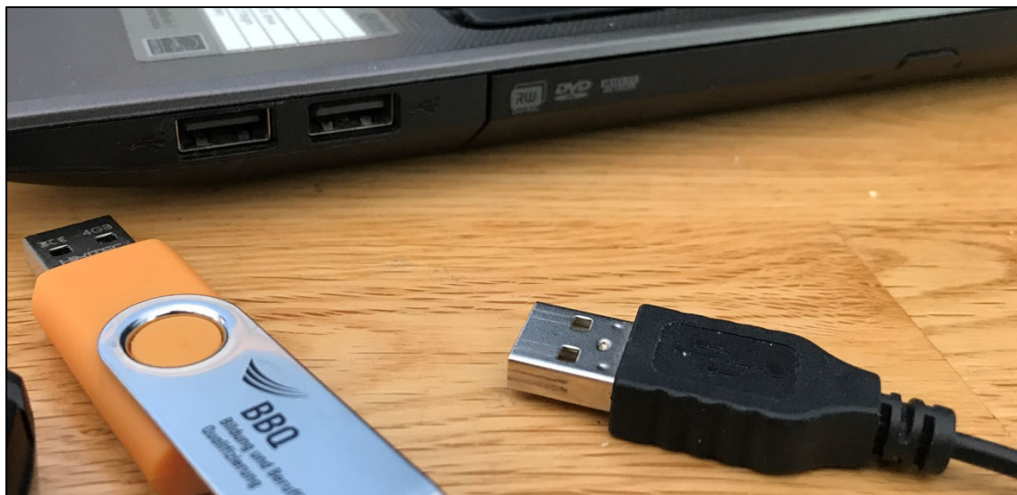
Abb. USB-Anschluss von Computermaus, Drucker, Smartphone, Datenstick